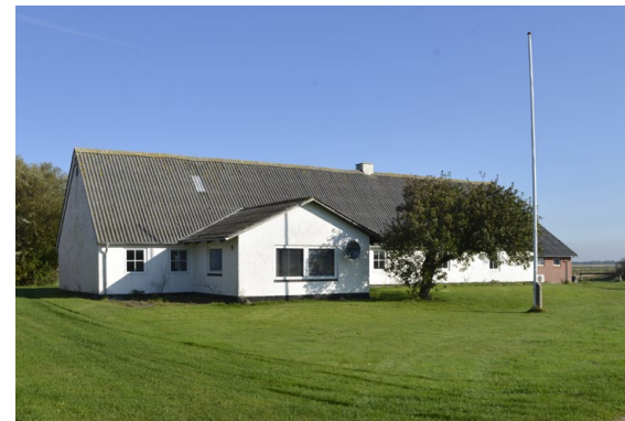
Stuehuset på Midtvej 7. Bagerst til højre ses den tidligere staldbygning.

Både de indvendige og udvendige dele af projektet gennemføres i et forpligtende samarbejde med Mandøforeningen. Dermed sikres det lokale ejerskab til projektet.