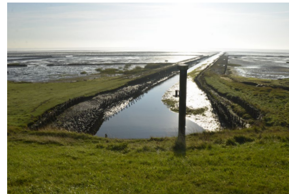
Slusen på Mandø's østkyst er et særligt sted på øen, som f.eks. kunne fremhæves med muligheder for ophold.

Mandø's placering midt i Vadehavet kan påvirke omkostningerne ved udvikling og anlæg af projekter, blandt andet i forhold til tid, økonomi og transport af arbejdskraft, materialer, mv. Der skal også tages hensyn til dyreliv og ynglesæsoner, som kan sætte begrænsninger for tidspunkter for anlægsarbejde.