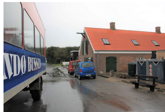
Trafikken i Mandø By dominerer bybilledet og slører oplevelsen af landsbymiljøet.

Mandøs placering midt i Vadehavet kan påvirke omkostningerne ved udvikling og anlæg af projekter, blandt andet i forhold til tid, økonomi og transport af arbejdskraft, materialer, mv. Der skal også tages hensyn til dyreliv og ynglesæsoner, som kan sætte begrænsninger for tidspunkter for anlægsarbejde og byggeri.